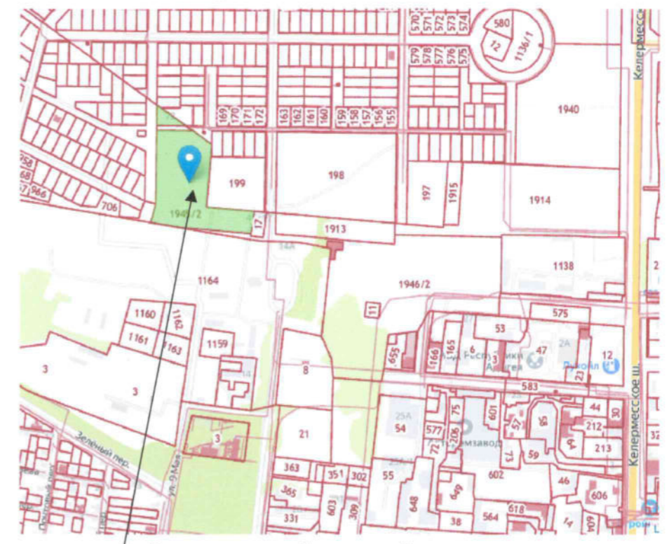
Рассматриваемый земельный участок